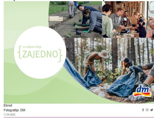
Ebrod 11.04.2022